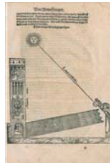
Johann Stöffler Von Künstlicher Abmessung aller gröse ebene oder nidere in die lenge höhe breite unnd tieffe Als gräben Cisternen und brunnen ... Mit einm Astrolabio und Quadranten oder meßleiter. ... Frankfurt am Main 1536 © Staatliche Museen zu Berlin, Kunstbibliothek