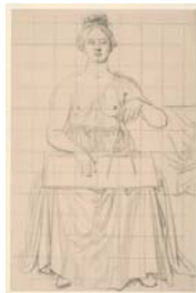
Johann Gottfried Schadow Allegorie der Geometrie, Zeichenstudie Bleistift, 230 x 150 mm