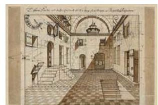
Johann Andreas Graff Perspektivische Zeichnung eines Hofes mit Einzeichnung aller konstruktiven Linien und Punkte. 1689 Federzeichnung, braun getuscht, 330 x 408 mm