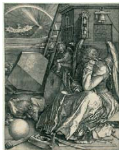
Albrecht Dürer Die Melencolia. 1514 Kupferstich, 239 x 168 mm