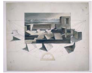
Friedrich Gilly Perspektivisches Studienblatt mit landschaftlicher Szenerie. 1798/99 Feder, aquarelliert über Graphit, 227 x 273 mm