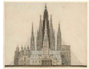
Charles Robert Cockerell (Höhen-)Vergleich hauptsächlich gotischer europäischer Gebäude und der Cheopspyramide. Um 1840 Graphit und Feder, grau und braun getuscht, 347 x 445 mm