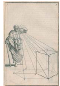
Abraham Bosse Maniere universelle de Mr. Desargues, pour pratiquer la perspective par petit-pied, comme le Geometral. Paris 1648