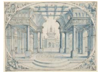
Hans Vredemann de Vries Vorzeichnung zu der Stichserie „Ovale Intarsienvorlagen“. Um 1562 Federzeichnung, blau getuscht, 160 x 217 mm