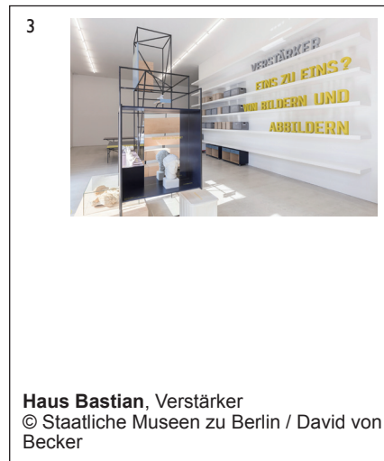
Haus Bastian, Verstärker