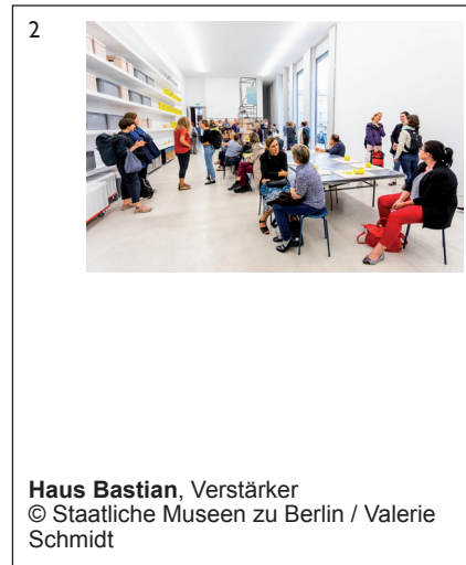
Haus Bastian, Verstärker