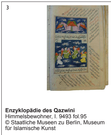
Enzyklopädie des Qazwini Himmelsbewohner, I. 9493 fol.95