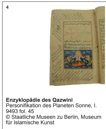
Enzyklopädie des Qazwini Personifikation des Planeten Sonne, I. 9493 fol. 45