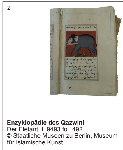
Enzyklopädie des Qazwini Der Elefant, I. 9493 fol. 492