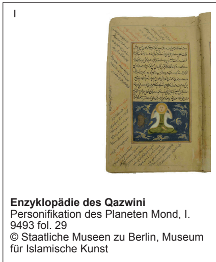
Enzyklopädie des Qazwini Personifikation des Planeten Mond, I. 9493 fol. 29

Pressebildanfragen pressebilder@smb.spk-berlin.de