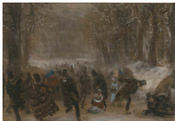
Adolph Menzel, Schlittschuhläufer, 1855/1856, Schwarze und farbige Kreiden (Pastell), teils gewischt und gekratzt, fixiert, über Blindmarkierungen, auf braunem Tonpapier (vélin), kaschiert, gefördert von der Beauftragten der Bundesregierung für Kultur und Medien und erworben mit Unterstützung der Kulturstiftung der Länder, der Ernst von Siemens Kunststiftung und der Rudolf-August Oetker-Stiftung