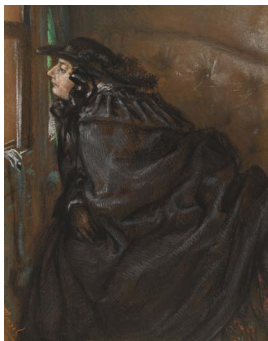
Adolph Menzel, Dame im Coupé , 1859, Schwarze und farbige Kreiden, teils gewischt, fixiert, über Blindmarkierungen, auf dunkelbraunem Tonpapier (vélin)