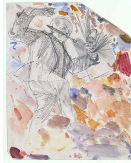
Adolph Menzel, Ein tanzender Maler (Selbstbildnis), Skizze zu „Kronprinz Friedrich besucht den Maler Antoine Pesne während der Arbeit auf dem Gerüst“, um 1861, Bleistift, teils gewischt, und Aquarell, auf Karton