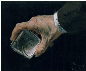
Adolph Menzel, Hand des Künstlers mit Farbnapf , 1864, Gouache, mit transparentem Überzug partiell akzentuiert, auf mit schwarzer Tusche getöntem, kaschiertem Papier (vélin)