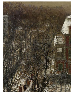
Adolph Menzel, Aschermittwochmorgen in der Hildebrandschen Privatstrasse zu Berlin , 1885, Aquarell und Gouache, über teils konstruierender Vorzeichnung mit Bleistift, mit transparentem Überzug partiell akzentuiert, auf hellbraunem Tonpapier (vélin)

Die honorarfreie Reproduktion ist nur im Rahmen der aktuellen Berichterstattung zur Ausstellung bei Nennung der vollständigen Creditline erlaubt. Bei jeder anderweitigen Nutzung sind Sie verpflichtet, selbstständig die Fragen des Urheber- und Nutzungsrechts zu klären. Eine Weitergabe an Dritte ist nicht erlaubt. Bitte beachten Sie , dass bei digitaler Veröffentlichung alle Fotos die Auflösung von 758 x 512 Pixel und 72 dpi nicht überschreiten dürfen. Die Pressefotos sind 4 Wochen nach Ablauf der Ausstellung aus allen Onlinemedien zu löschen. Mit freundlicher Bitte um Zusendung eines Belegexemplars an die Pressestelle der Staatlichen Museen zu Berlin.