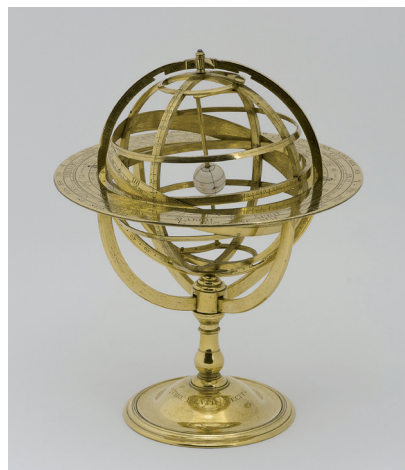
Thomas Heath Armillarsphäre , London, um 1750 Messing, gegossen, graviert und vergoldet, Elfenbein

Die honorarfreie Reproduktion ist nur im Rahmen der aktuellen Berichterstattung zur Ausstellung bei Nennung der vollständigen Creditline erlaubt. Bei jeder anderweitigen Nutzung sind Sie verpflichtet, selbstständig die Fragen des Urheber- und Nutzungsrechts zu klären. Eine Weitergabe an Dritte ist nicht erlaubt. Bitte beachten Sie , dass bei digitaler Veröffentlichung alle Fotos die Auflösung von 758 x 512 Pixel und 72 dpi nicht überschreiten dürfen. Die Pressefotos sind 4 Wochen nach Ablauf der Ausstellung aus allen Onlinemedien zu löschen. Mit freundlicher Bitte um Zusendung eines Belegexemplars an die Pressestelle der Staatlichen Museen zu Berlin.