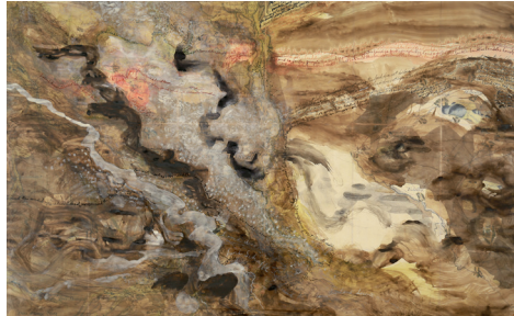
Liz Crossley The land does not belong to us , 2011 Tusche auf Landkarte © Liz Crossley; Foto: Lisa Vanovitch