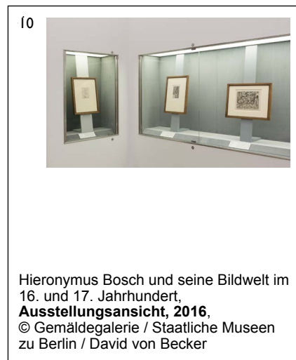
Hieronymus Bosch und seine Bildwelt im 16. und 17. Jahrhundert, Ausstellungsansicht, 2016, © Gemäldegalerie / Staatliche Museen zu Berlin / David von Becker

Die honorarfreie Reproduktion ist nur im Rahmen der aktuellen Berichterstattung zur Ausstellung bei Nennung der vollständigen Creditline erlaubt. Bei jeder anderweitigen Nutzung sind Sie verpflichtet, selbstständig die Fragen des Urheber- und Nutzungsrechts zu klären. Eine Weitergabe an Dritte ist nicht erlaubt. Bitte beachten Sie , dass bei digitaler Veröffentlichung alle Fotos die Auflösung von 758 x 512 Pixel und 72 dpi nicht überschreiten dürfen. Die Pressefotos sind 4 Wochen nach Ablauf der Ausstellung aus allen Onlinemedien zu löschen. Mit freundlicher Bitte um Zusendung eines Belegexemplars an die Pressestelle der Staatlichen Museen zu Berlin.