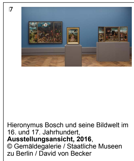
Hieronymus Bosch und seine Bildwelt im 16. und 17. Jahrhundert, Ausstellungsansicht, 2016, © Gemäldegalerie / Staatliche Museen zu Berlin / David von Becker

Pressefotoanfragen pressebilder@smb.spk-berlin.de