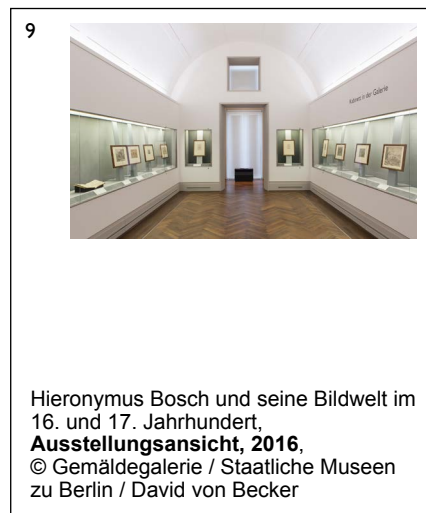
Hieronymus Bosch und seine Bildwelt im 16. und 17. Jahrhundert, Ausstellungsansicht, 2016, © Gemäldegalerie / Staatliche Museen zu Berlin / David von Becker