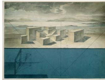
Friedrich Gilly Perspektivisches Studienblatt mit landschaftlicher Szenerie Feder, aquarelliert über Graphit 22,7 x 27,3 cm. Hdz 7719 Staatliche Museen zu Berlin, Kunstbibliothek

Staatliche Museen zu Berlin Generaldirektion Stauffenbergstraße 41 10785 Berlin