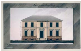
Friedrich Bosse Aufriss eines fünfachsigen, zweigeschossigen Wohnhauses, 1803 Feder, koloriert 24,5 x 41,4 cm. Hdz 5675 Staatliche Museen zu Berlin, Kunstbibliothek