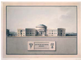
Friedrich Gilly Entwurf Börse im Lustgarten, Schaubild 1799 Feder, Deckfarben aquarelliert 26,7 x 39 cm. Hdz 5616 Staatliche Museen zu Berlin, Kunstbibliothek