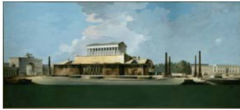
Friedrich Gilly (1772-1800) Entwurf Denkmal Friedrich II, 1797 Feder in Schwarz, Deckfarben, aquarelliert 59,6 x 135,2 cm. Gilly SZ 5 Staatliche Museen zu Berlin, Kupferstichkabinett