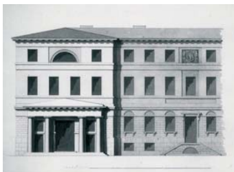
Schule des Friedrich Gilly Entwurf eines dreigeschossigen, öffentlichen Gebäudes Feder, laviert 28,6 x 40,6 cm. Hdz 5660 Staatliche Museen zu Berlin, Kunstbibliothek

Mit freundlicher Bitte um Zusendung eines Belegexemplares an die SMB-Pressestelle. Honorarfreie Reproduktion ist nur für die Dauer der Ausstellung erlaubt.