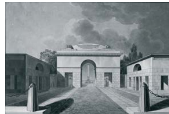
Friedrich Gilly (1772-1800) Klassizistische Stadttoranlage mit antiken Staffagefiguren, um 1799 Feder, laviert 28,5 x 43,3 cm. Hdz 5665 Staatliche Museen zu Berlin, Kunstbibliothek

Pressemitteilungen: www.smb.museum/pressemitteilungen