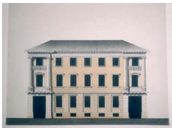
Unbekannt Aufriß eines Wohnhauses in der Behrenstraße, um 1790 Feder in Braun, schwarzer Stift, aquarelliert 31,8 x 41,4 cm. Hdz 7766 Staatliche Museen zu Berlin, Kunstbibliothek

Mit freundlicher Bitte um Zusendung eines Belegexemplares an die SMB-Pressestelle. Honorarfreie Reproduktion ist nur für die Dauer der Ausstellung erlaubt.