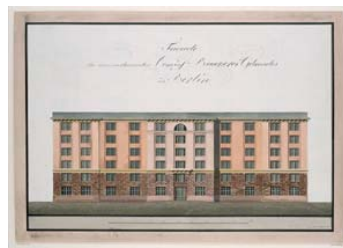
Carl Ludwig Engel Entwurf für eine Kommiss-Bäckerei, 1806 Feder in grau, Deckfarben aquarelliert 44,5 x 63,3 cm. Hdz 4616 Staatliche Museen zu Berlin, Kunstbibliothek

Pressemitteilungen: www.smb.museum/pressemitteilungen