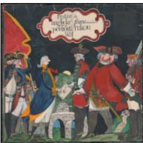
Reinzeichnung für James Fenimore Cooper: Poslední Mohykán (Der letzte Mohikaner) Mladá fronta , Prag 1972 Mischtechnik. 60,4 x 61,4 cm © Jiří Šalamoun