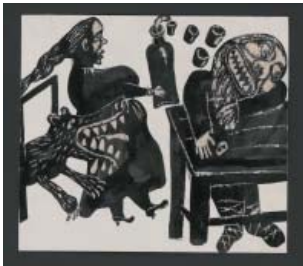
Reinzeichnung für Ivan Alekseevic Bunin: Pán ze San Franciska (Der Herr aus San Francisco) Naše vojsko , Prag 1970 Feder, Pinsel, Tusche, Deckweiß, Kratztechnik 25 x 28,5 cm © Jiří Šalamoun