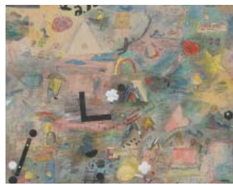
Diář Vokabulár (Tagebuch der Wörter) . 1985/2005 Feder, Tusche, Bleistift, Farbstift 55,5 x 69,8 cm © Jiří Šalamoun