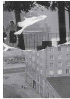
Luise Schröder Arbeit am Mythos 2011