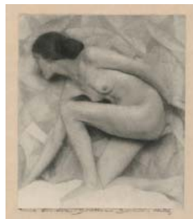
Erna Lendvai-Dirksen Weiblicher Akt 1921 oder früher

Die honorarfreie Reproduktion ist nur im Rahmen der aktuellen Berichterstattung zur Ausstellung bei Nennung der vollständigen Creditline erlaubt. Bei jeder anderweitigen Nutzung sind Sie verpflichtet, selbständig die Fragen des Urheber- und Nutzungsrechts zu klären. Eine Weitergabe an Dritte ist nicht erlaubt. Die Pressefotos sind 4 Wochen nach Ablauf der Ausstellung aus allen Onlinemedien zu löschen. Mit freundlicher Bitte um Zusendung eines Belegexemplars an die Pressestelle der Staatlichen Museen zu Berlin.