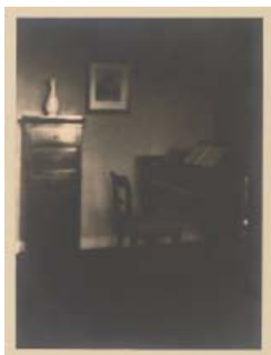
Elsa Gysae Interieur 1921 oder früher