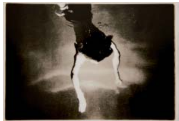
Miriam Schwedt Ohne Titel 2011 © Miriam Schwedt, www.guteaussichten.org