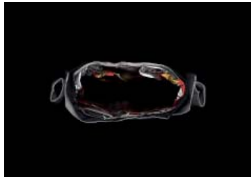
Johannes Post Inform 2011