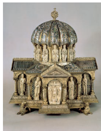
Kuppelreliquiar Köln, gegen 1200 Eichenholzkern; Kupfergrubenschmelz, Walrosszahn; Bronze, gegossen und vergoldet, Kupfer- und Silberbleche Höhe 45,3 cm, Breite und Tiefe 41 cm Inv. Nr. W 15