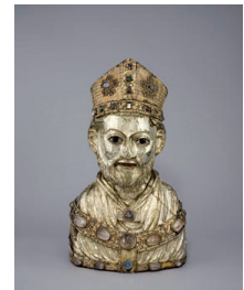
Büstenreliquiar des hl. Blasius Braunschweig (?), Mitte 14. Jahrhundert Eichenholzkern; Silberblech, getrieben, gestanz und vergoldet; Filigran, Edelsteine, Perlen, Glasflüsse, Silbergrubenschmelz Höhe 51,5 cm, Breite 30,8 cm Inv. Nr. W 30