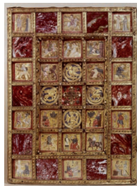
Plenar Herzog Ottos des Mildes Braunschweig 1339 (Einband) Vorderdeckel: Silber, gegossen, vergoldet, Silberblech, graviert, vergoldet; Jaspis, Bergkristall und Pergamentmalereien (unter Verwendung eines venezianischen Schachbrettes) Höhe 35,4 cm, Breite 26 cm Inv. Nr. W 32