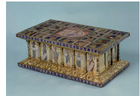
Tragalтар des Eilbertus Köln, um 1150 Eichenholzkern; Kupfergruben- und Kupferzellenschmelz, Kupfer, vergoldet, Altarstein Bergkristall, darunter Pergamentmalerei Höhe 13,3 cm, Breite 35,7 cm, Tiefe 20,9 cm Inv. Nr. W 11