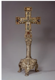
Welfenkreuz Südtalien, 1. Hälfte 12. Jahrhundert Gold, Goldzellenschmelz, Goldfiligran, Niello, Edelsteine, Perlen; Fuß Silber, gegossen Höhe (mit Fuß) 33,1 cm, Breite 12,5 cm Inv. Nr. W 1